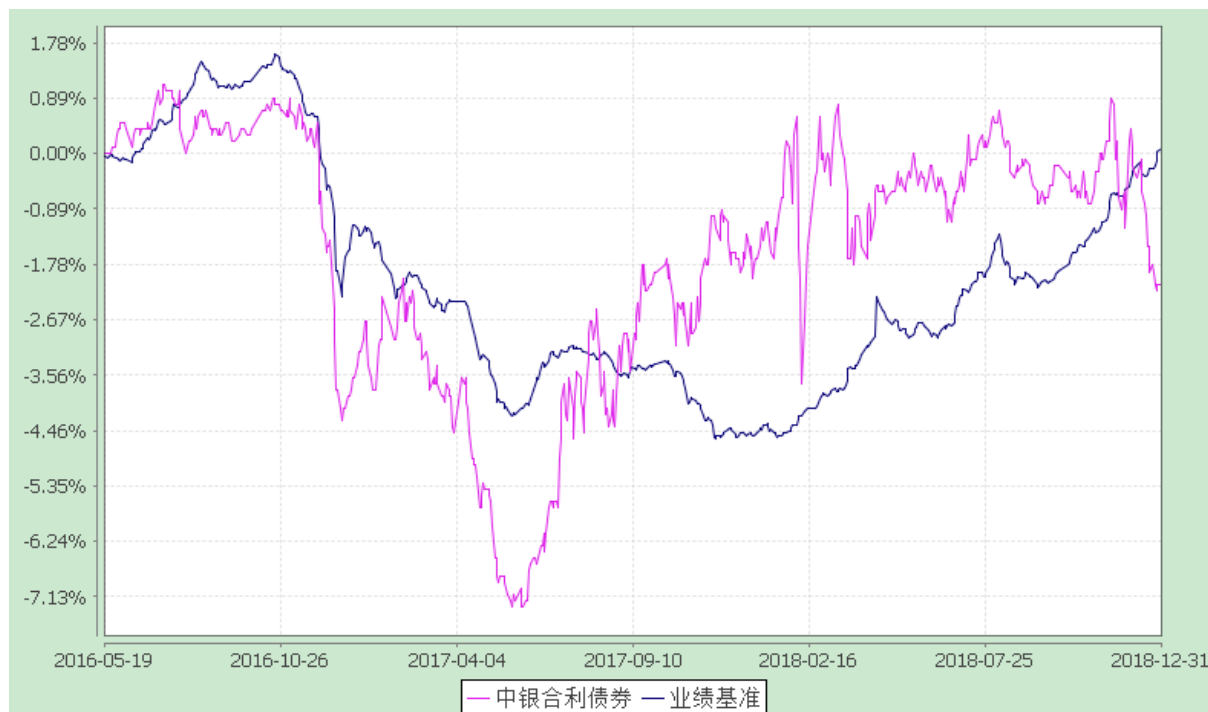
份额累计净值增长率与业绩比较基准收益率的历史走势对比图 (2016 年 5 月 19 日至 2018 年 12 月 31 日)

注：按基金合同规定，本基金自基金合同生效起 6 个月内为建仓期，截至建仓结束时各项资产配置比例均符合基金合同约定。