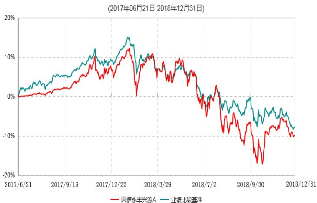
圆信永丰兴源A累计净值增长率与业绩比较基准收益率历史走势对比图