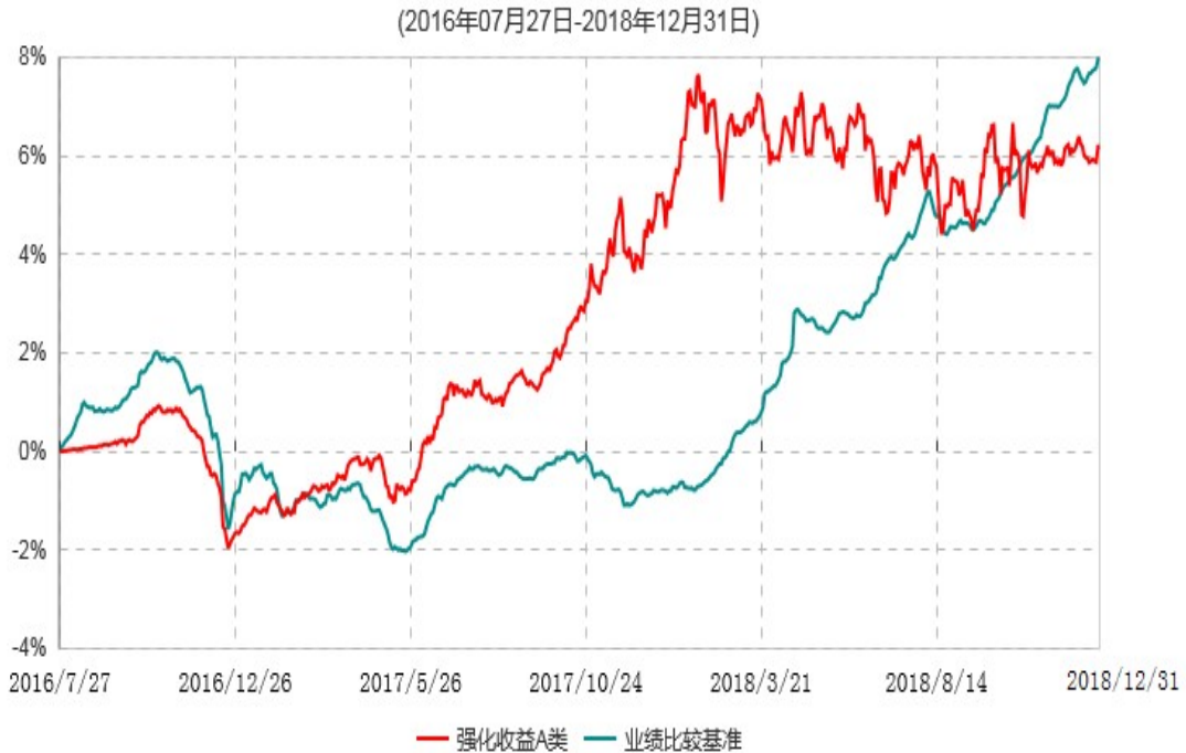
强化收益A类累计净值增长率与业绩比较基准收益率历史走势对比图