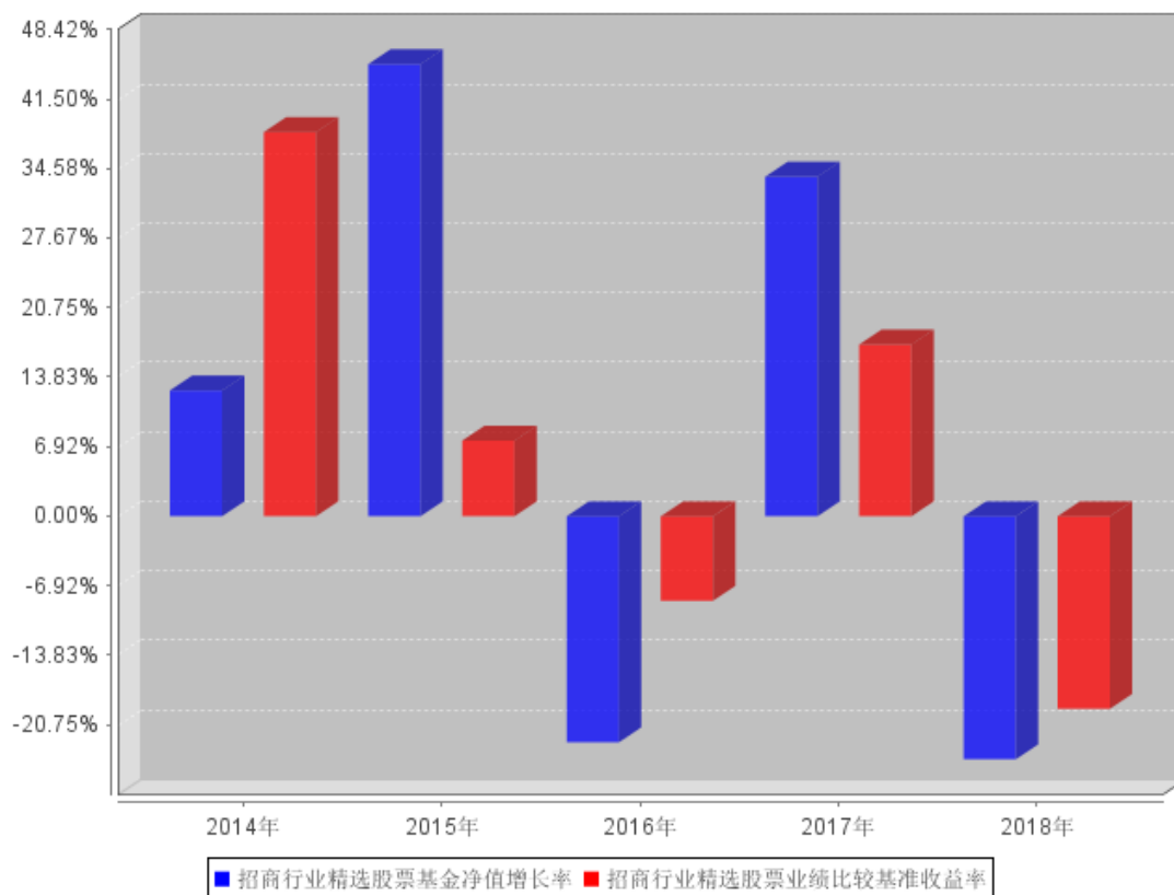
招商行业精选股票自基金合同生效以来基金每年净值增长率及其与同期业绩比较基准收益率的对比图

注：本基金于 2014 年 9 月 3 日成立，截至 2014 年 12 月 31 日基金成立未满 1 年，故成立当年净值增长率按当年实际存续期计算。