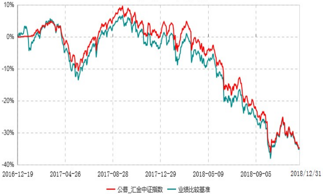
浙商汇金中证转型成长指数型证券投资基金累计净值增长率与业绩比较基准收益率历史走势对比图 (2016年12月19日-2018年12月31日)