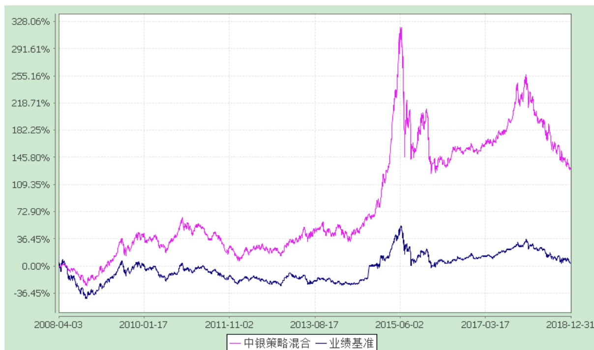
中银动态策略混合型证券投资基金 份额累计净值增长率与业绩比较基准收益率的历史走势对比图 (2008 年 4 月 3 日至 2018 年 12 月 31 日)

注：按基金合同规定，本基金自基金合同生效起 6 个月内为建仓期，截至建仓结束时各项资产配置比例均符合基金合同约定。