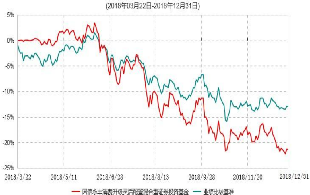
圆信永丰消费升级灵活配置混合型证券投资基金累计净值增长率与业绩比较基准收益率历史走势对比图

注：自基金合同生效后，截止报告期末，本基金成立不满一年。截止报告期末，本基金已完成建仓但报告期末距建仓结束不满一年，建仓期结束时各项资产配置比例符合合同约定。