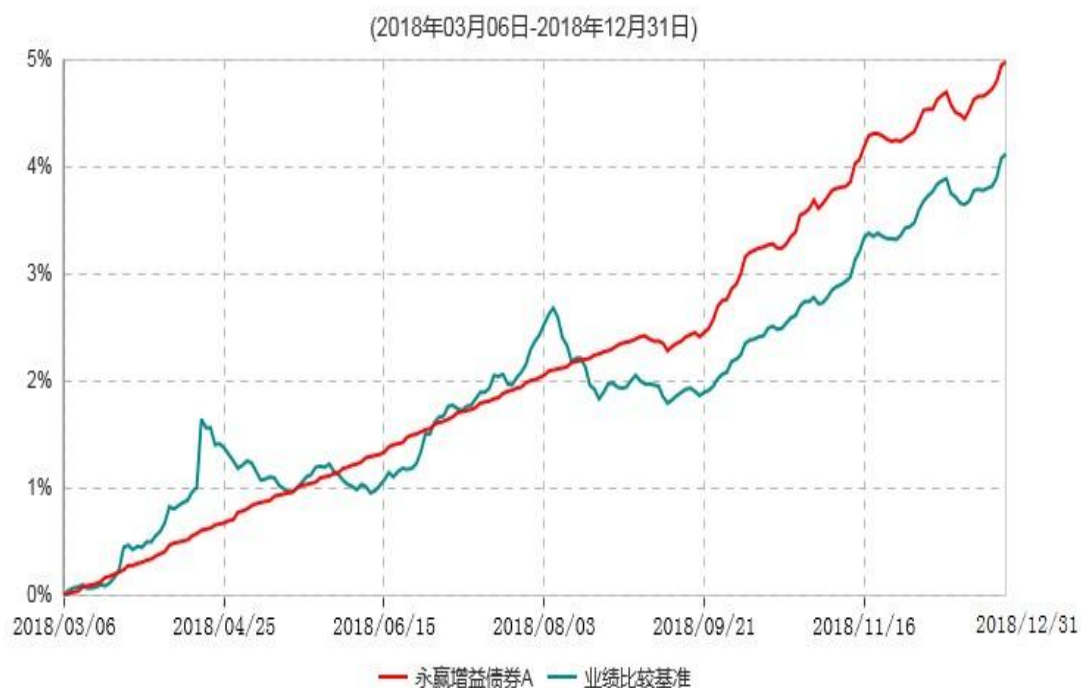
永赢增益债券A累计净值增长率与业绩比较基准收益率历史走势对比图

注：1、本基金合同生效日为2018年3月6日，截至本报告期末本基金合同生效未满1年；