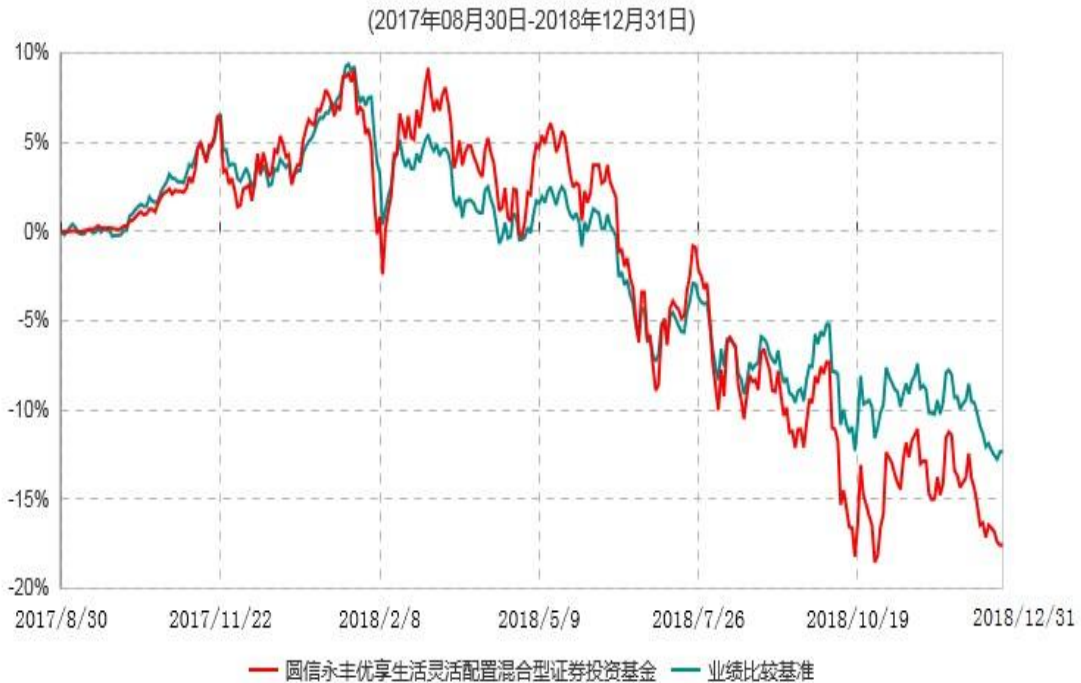
圆信永丰优享生活灵活配置混合型证券投资基金累计净值增长率与业绩比较基准收益率历史走势对比图

注：自基金合同生效日起，截止报告期末，本基金已完成建仓但报告期末距建仓结束不满一年，建仓结束时各项资产配置比例符合合同约定。