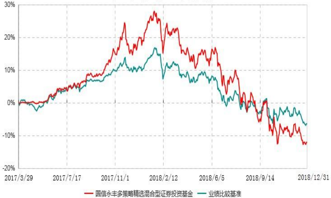
圆信永丰多策略精选混合型证券投资基金累计净值增长率与业绩比较基准收益率历史走势对比图 (2017年03月29日-2018年12月31日)