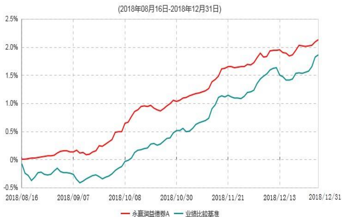
永赢润益债券A累计净值增长率与业绩比较基准收益率历史走势对比图

注：1、本基金合同生效日为2018年8月16日，截至本报告期末基金合同生效未满1年。