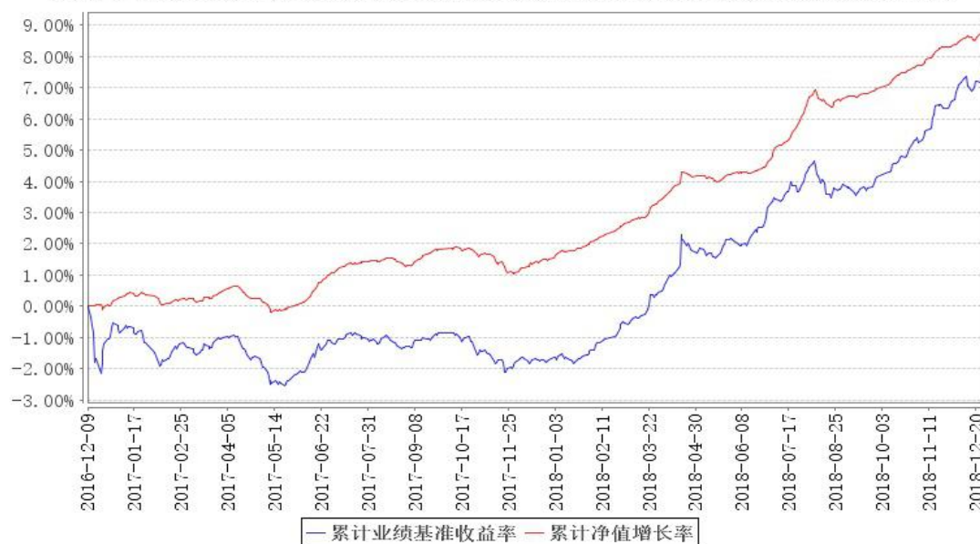
鹏华丰惠债券累计净值增长率与同期业绩比较基准收益率的历史走势对比图