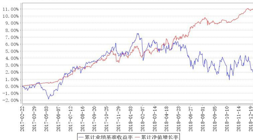
鹏华安益增强混合累计净值增长率与同期业绩比较基准收益率的历史走势对比图