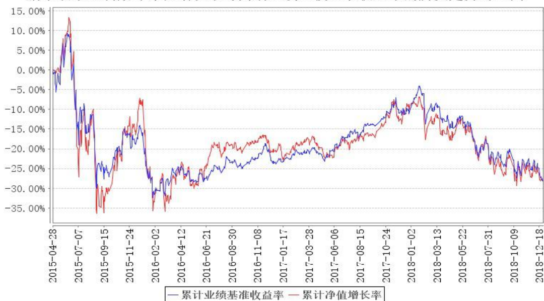
鹏华改革红利累计净值增长率与同期业绩比较基准收益率的历史走势对比图