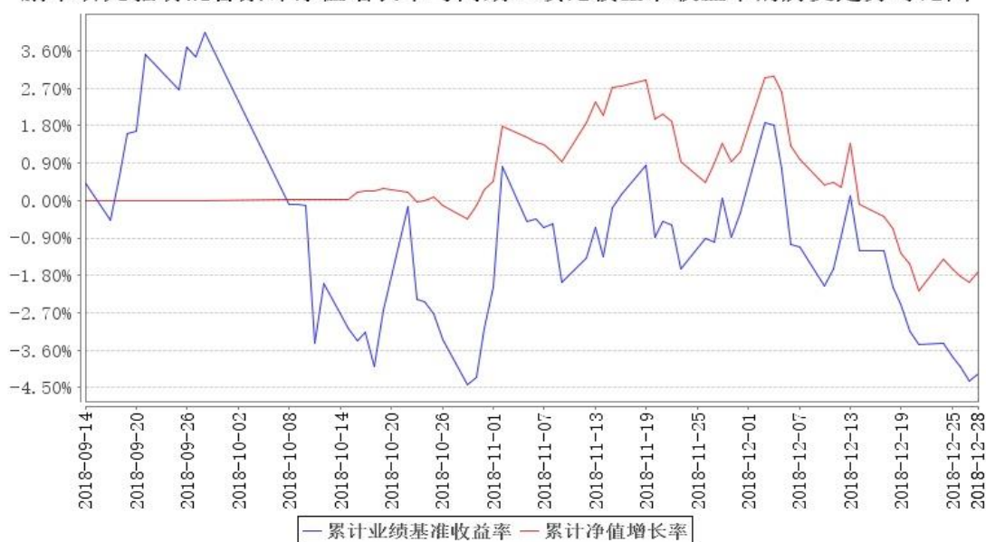
鹏华研究驱动混合累计净值增长率与同期业绩比较基准收益率的历史走势对比图

注：1、本基金基金合同于 2018 年 09 月 14 日生效，截至本报告期末本基金基金合同生效未满一 第 6 页 共 35 页