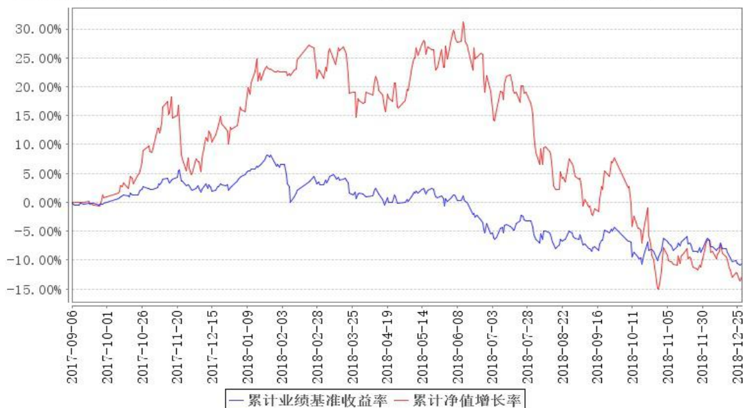
鹏华策略回报混合累计净值增长率与同期业绩比较基准收益率的历史走势对比图