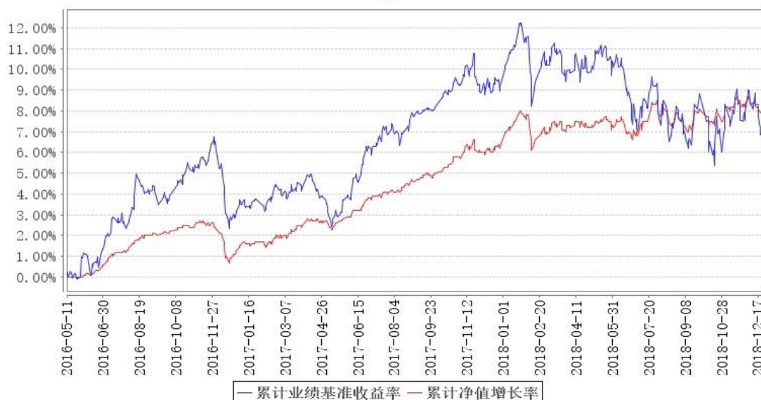
鹏华兴利定期开放混合累计净值增长率与同期业绩比较基准收益率的历史走势对比图