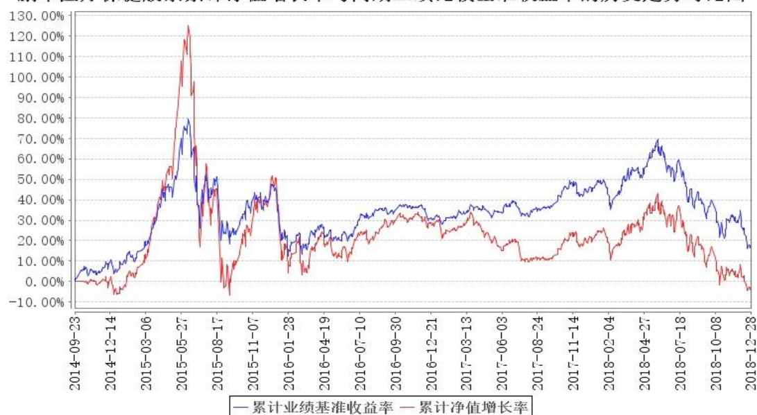
鹏华医疗保健股票累计净值增长率与同期业绩比较基准收益率的历史走势对比图