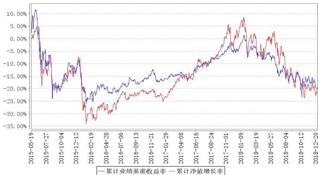
鹏华外延成长累计净值增长率与同期业绩比较基准收益率的历史走势对比图