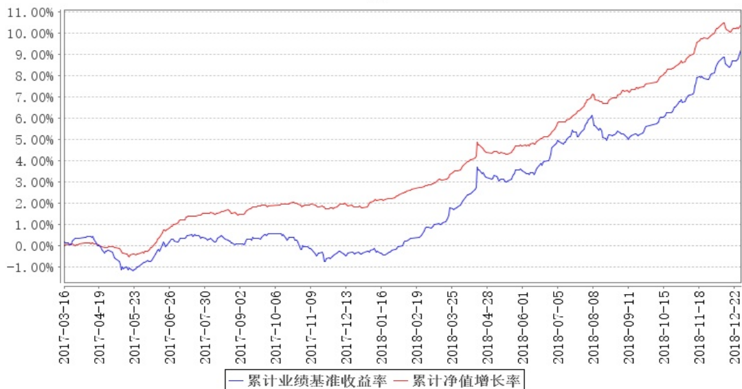
鹏华永安定期开放债券累计净值增长率与同期业绩比较基准收益率的历史走势对比图