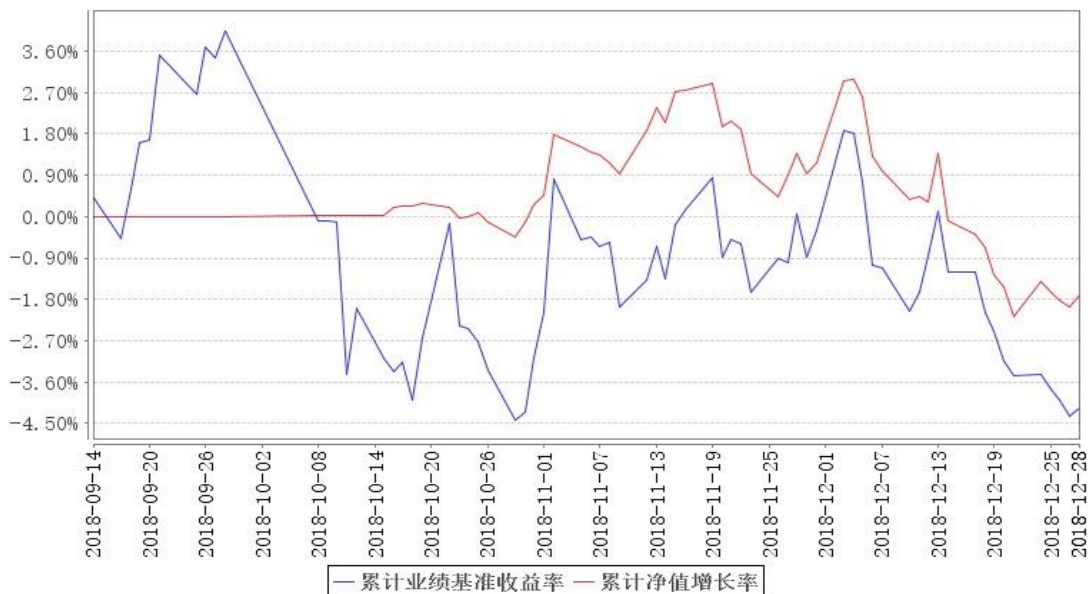
鹏华研究驱动混合累计净值增长率与同期业绩比较基准收益率的历史走势对比图

注：1、本基金基金合同于 2018 年 09 月 14 日生效，截至本报告期末本基金基金合同生效未满一年。2、本基金管理人将严格按照本基金合同的约定，于本基金建仓期届满后确保各项投资比例符合基金合同的约定。