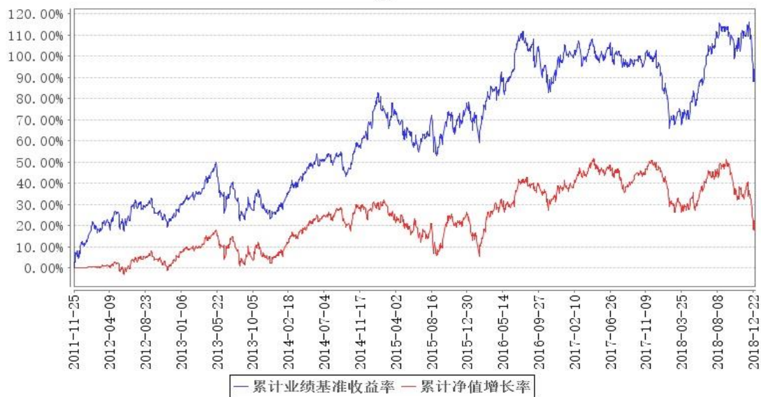
鹏华美国房地产 (QDII) 累计净值增长率与同期业绩比较基准收益率的历史走势对比图