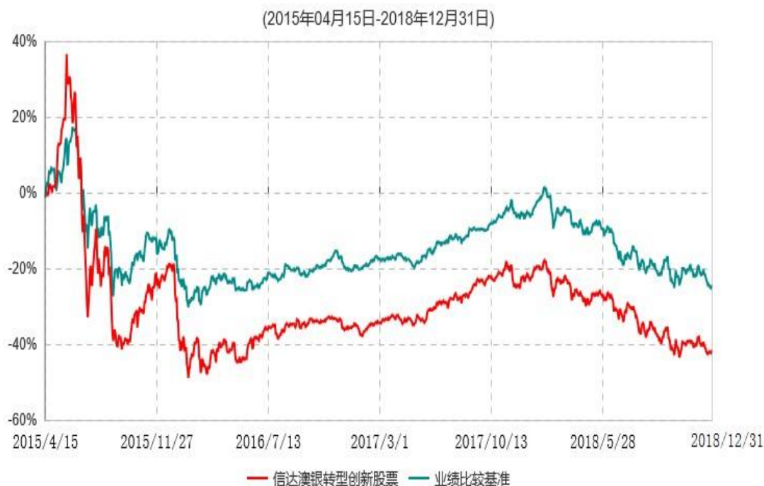
信达澳银转型创新股票型证券投资基金累计净值增长率与业绩比较基准收益率历史走势对比图

注：1、本基金基金合同于2015年4月15日生效，2015年5月18日开始办理申购、赎回业务。