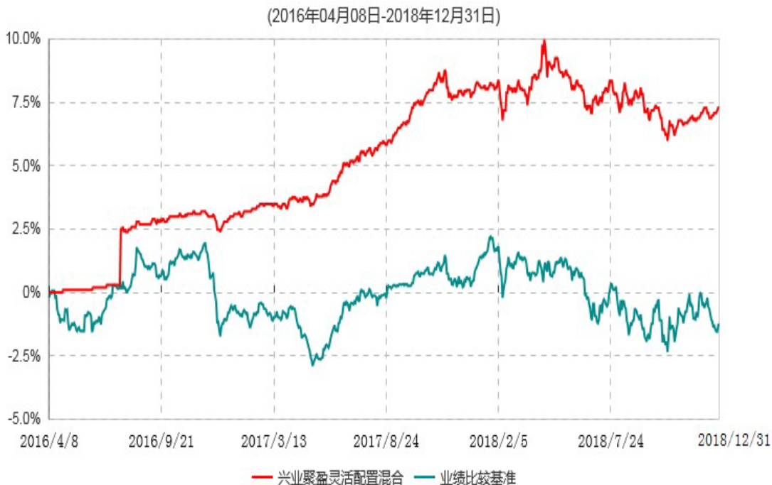
兴业聚盈灵活配置混合型证券投资基金累计净值增长率与业绩比较基准收益率历史走势对比图