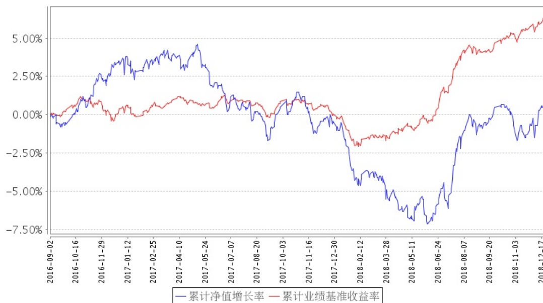
招商信用定开债(QDII)累计净值增长率与同期业绩比较基准收益率的历史走势对比图