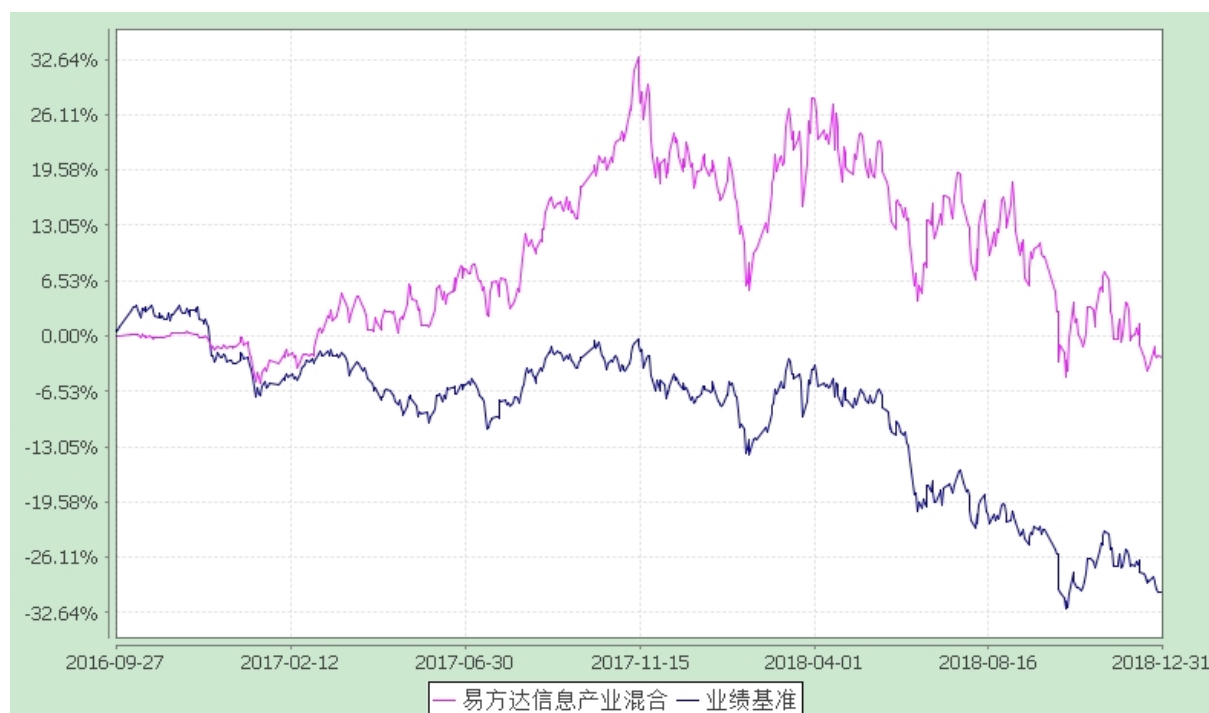
易方达信息产业混合型证券投资基金 份额累计净值增长率与业绩比较基准收益率历史走势对比图 (2016年9月27日至2018年12月31日)

注：自基金合同生效至报告期末，基金份额净值增长率为-2.50%，同期业绩比较基准收益率为-30.21%。