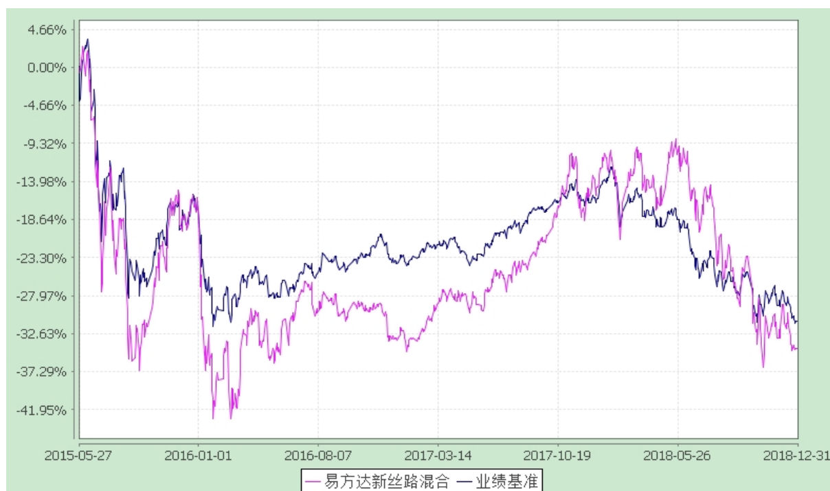
易方达新丝路灵活配置混合型证券投资基金 份额累计净值增长率与业绩比较基准收益率历史走势对比图 (2015年5月27日至2018年12月31日)

注：自基金合同生效至报告期末，基金份额净值增长率为-34.50%，同期业绩比较基准收益率为-31.10%。