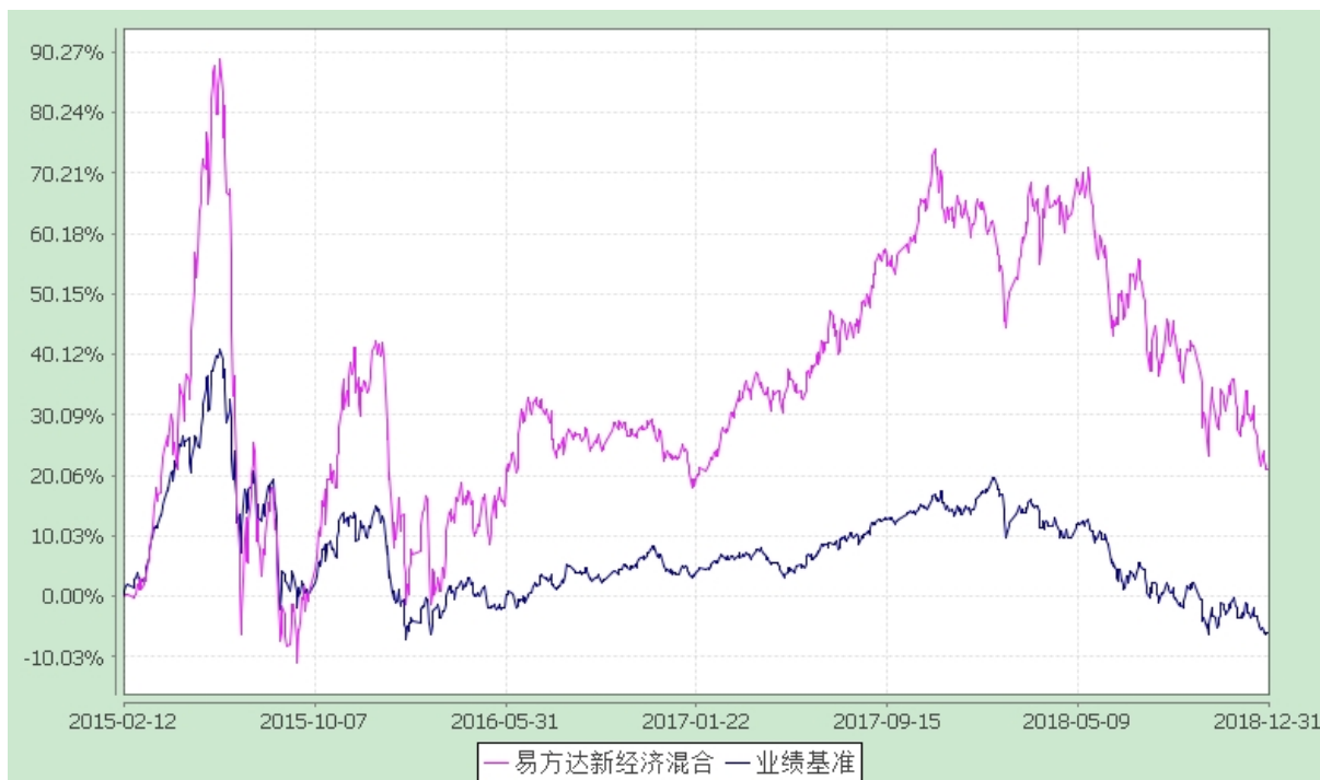
易方达新经济灵活配置混合型证券投资基金 份额累计净值增长率与业绩比较基准收益率历史走势对比图 (2015 年 2 月 12 日至 2018 年 12 月 31 日)

注：自基金合同生效至报告期末，基金份额净值增长率为 21.10%，同期业绩比较基准收益率为-6.07%。