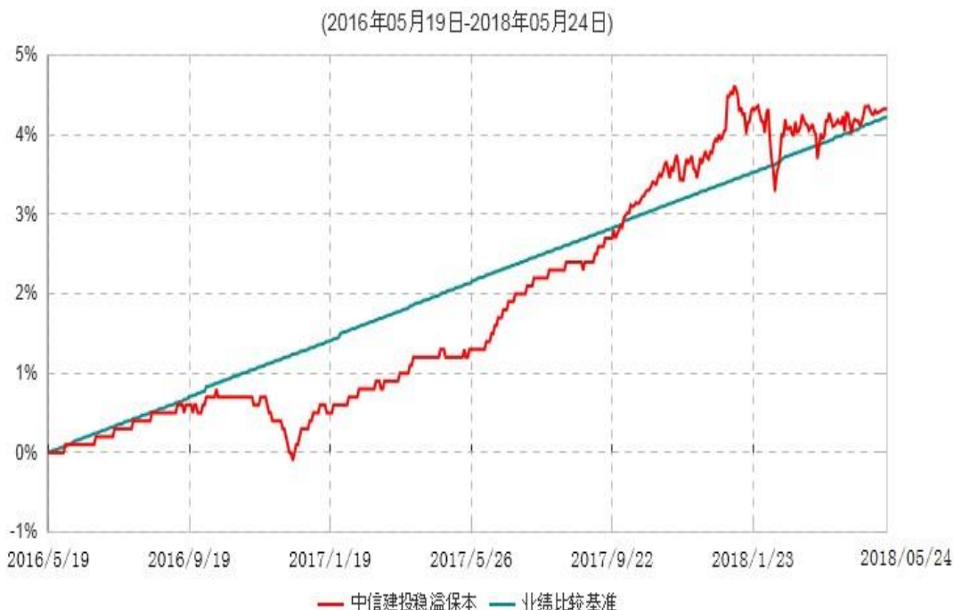
中信建投稳溢保本混合型证券投资基金累计净值增长率与业绩比较基准收益率历史走势对比图

注：根据《中信建投稳溢保本混合型证券投资基金基金合同》的有关规定，2018年5月21日为本基金的第一个保本周期到期日。