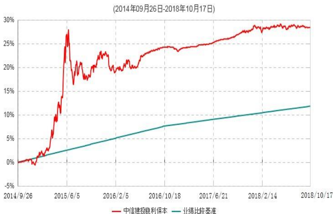
中信建投稳利保本混合型证券投资基金累计净值增长率与业绩比较基准收益率历史走势对比图

注：根据《中信建投稳利保本混合型证券投资基金基金合同》的有关规定，2018年10月12日为本基金的第一个保本周期到期日。