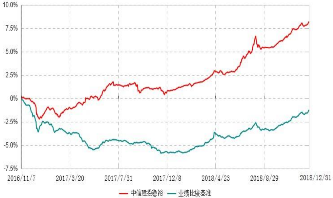
中信建投稳裕定期开放债券型证券投资基金累计净值增长率与业绩比较基准收益率历史走势对比图 (2016年11月07日-2018年12月31日)