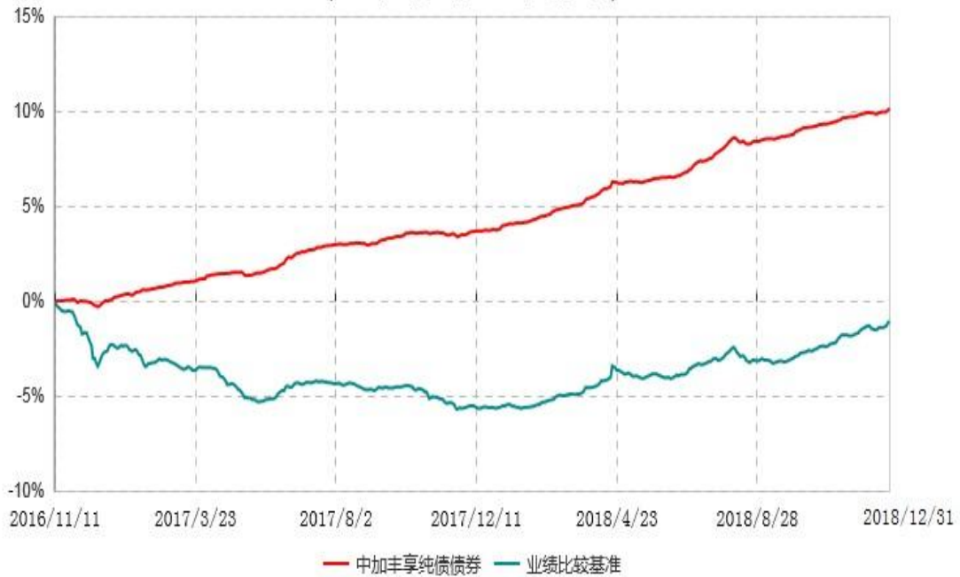
中加丰享纯债债券型证券投资基金累计净值增长率与业绩比较基准收益率历史走势对比图 (2016年11月11日-2018年12月31日)