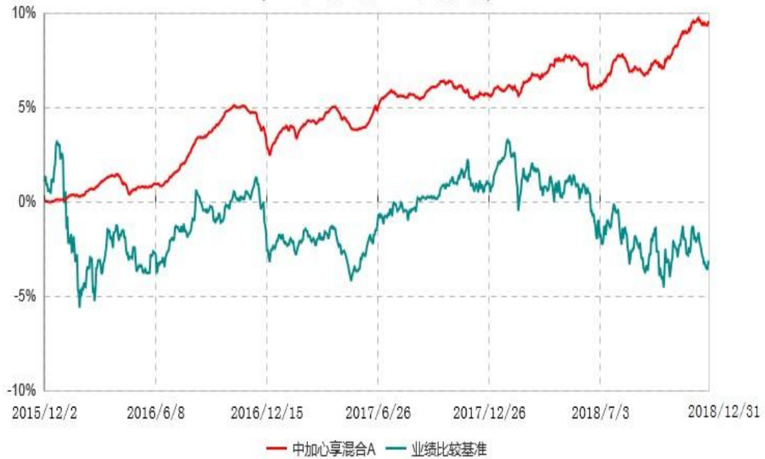
中加心享混合C累计净值增长率与业绩比较基准收益率历史走势对比图