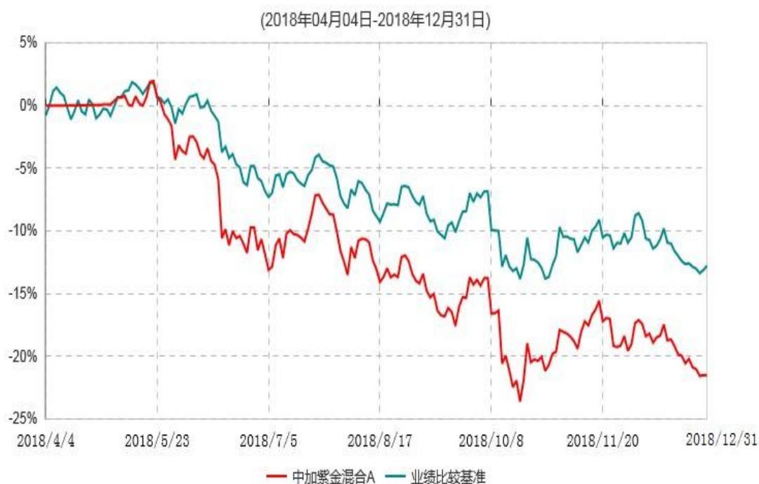
中加紫金混合A累计净值增长率与业绩比较基准收益率历史走势对比图