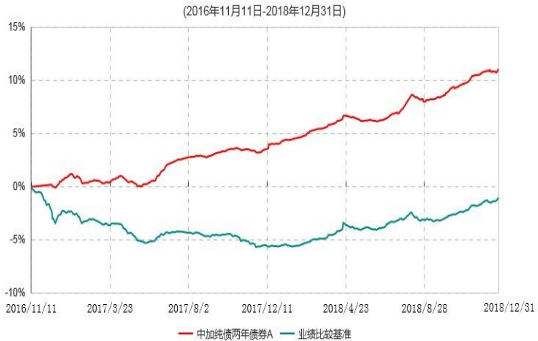
中加纯债两年债券A累计净值增长率与业绩比较基准收益率历史走势对比图