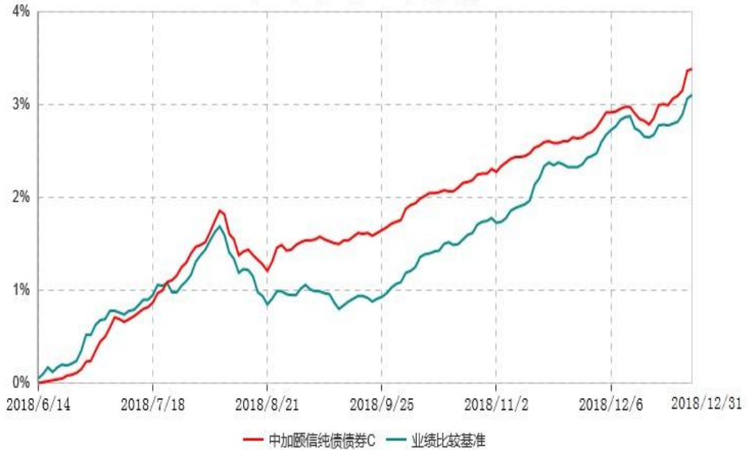
中加颐信纯债债券C累计净值增长率与业绩比较基准收益率历史走势对比图 (2018年06月14日-2018年12月31日)

注：1. 本基金基金合同于 2018 年 6 月 14 日生效，截至报告期末，本基金基金合同生效不满一年。 2. 按基金合同规定，本基金建仓期为 6 个月，截至报告期末，已完成建仓，本基金的各项投资比例符合基金合同关于投资范围及投资限制规定。