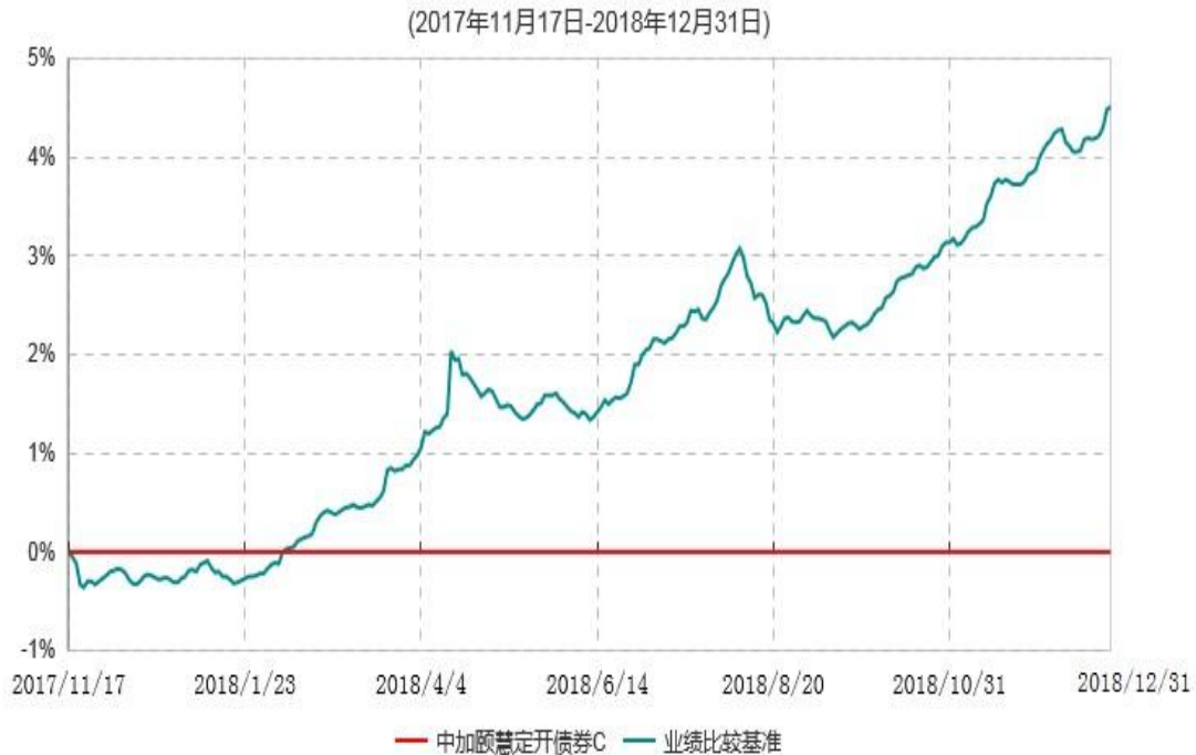
中加颐慧定开债券C累计净值增长率与业绩比较基准收益率历史走势对比图