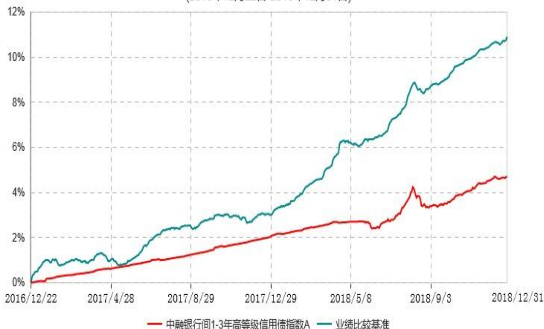
中融银行间1-3年高等级信用债指数C累计净值增长率与业绩比较基准收益率历史走势对比图