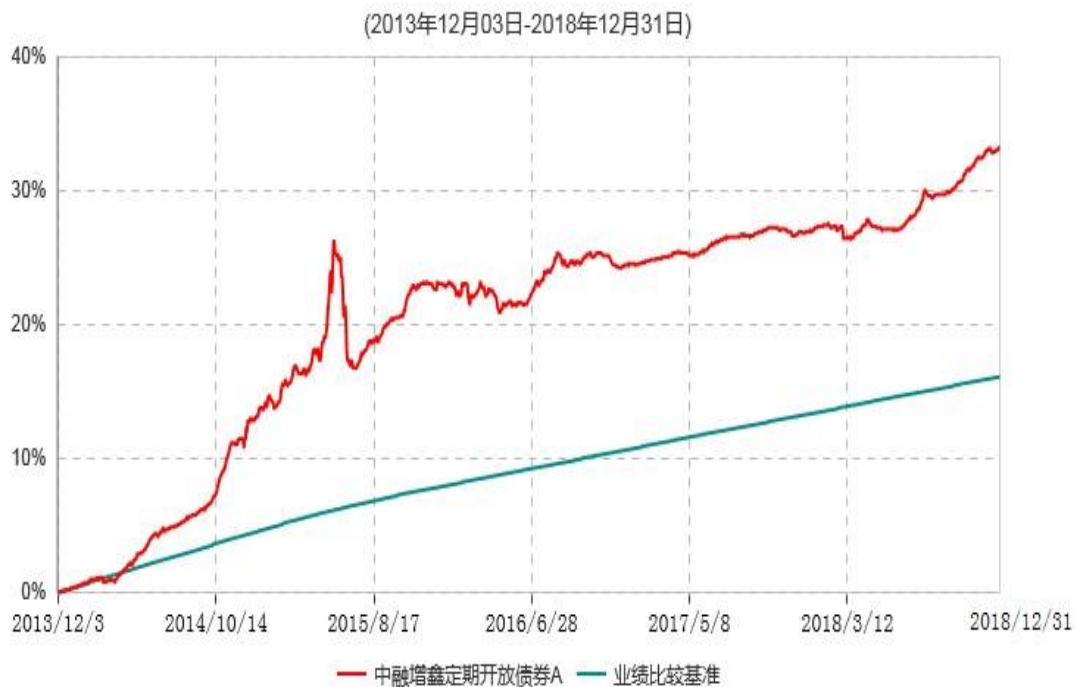
中融增鑫定期开放债券A累计净值增长率与业绩比较基准收益率历史走势对比图