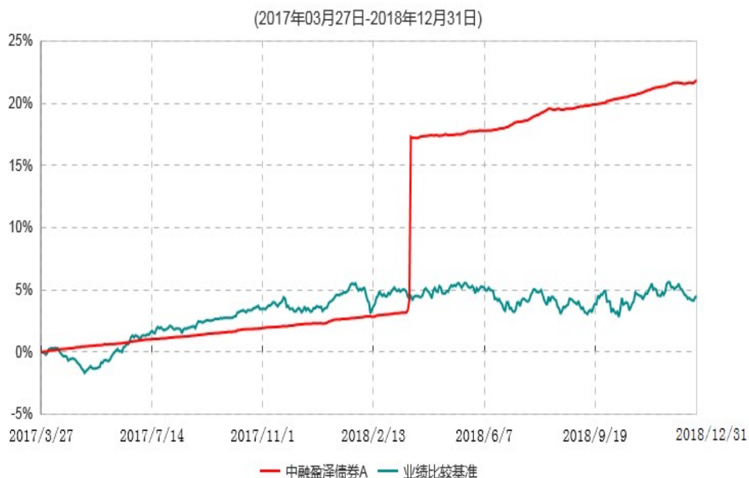
中融盈泽债券A累计净值增长率与业绩比较基准收益率历史走势对比图