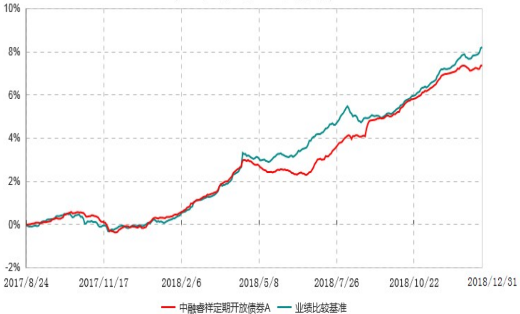
中融睿祥定期开放债券A累计净值增长率与业绩比较基准收益率历史走势对比图 (2017年08月24日-2018年12月31日)