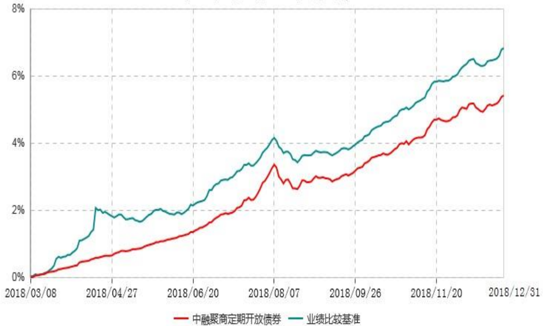
中融聚商3个月定期开放债券型发起式证券投资基金累计净值增长率与业绩比较基准收益率历史走势对比图 (2018年03月08日-2018年12月31日)

注：按照基金合同和招募说明书的约定，本基金自合同生效日起6个月内为建仓期，建仓期结束时本基金的各项资产配置比例符合基金合同的有关约定。