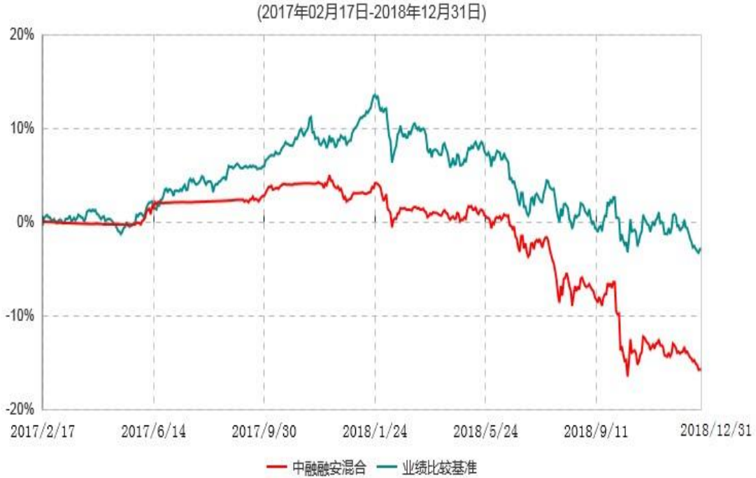
中融融安灵活配置混合型证券投资基金累计净值增长率与业绩比较基准收益率历史走势对比图

注：按照基金合同和招募说明书的约定，本基金自合同生效日起6个月内为建仓期，建仓期结束时本基金的各项资产配置比例符合基金合同的有关约定。