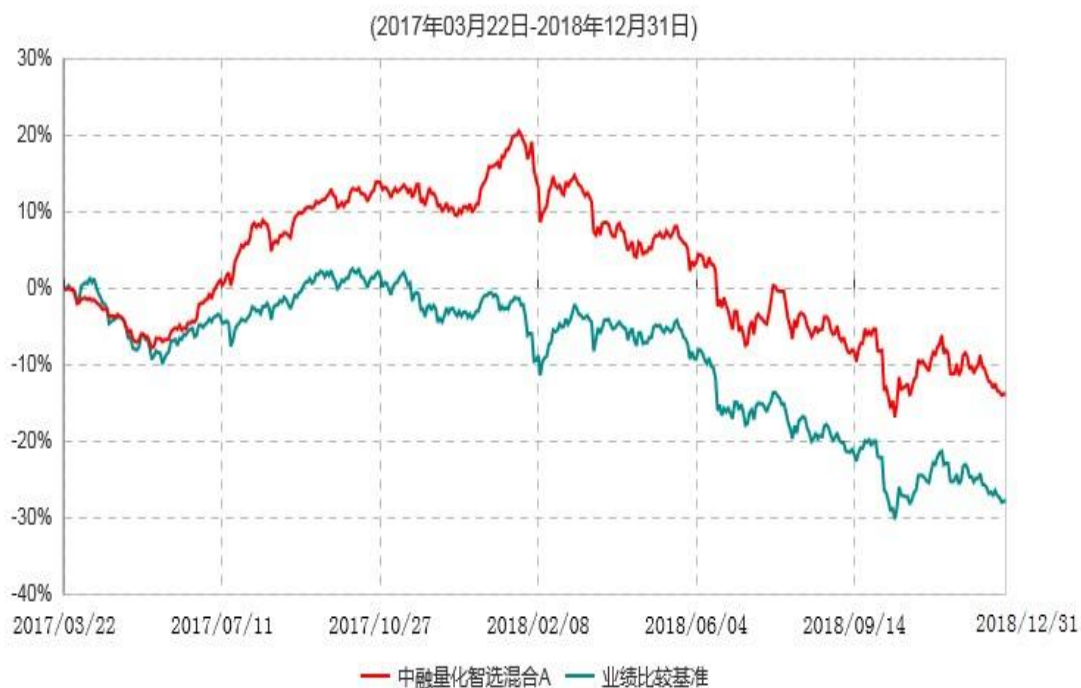
中融量化智选混合A累计净值增长率与业绩比较基准收益率历史走势对比图