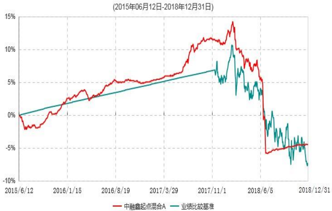
中融鑫起点混合A累计净值增长率与业绩比较基准收益率历史走势对比图