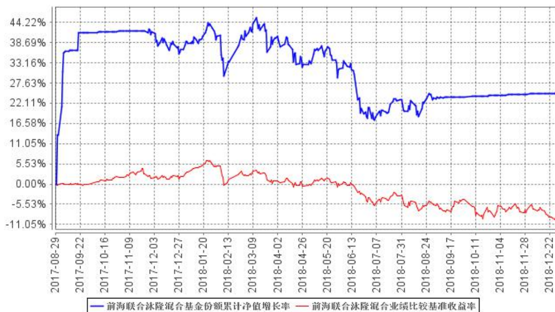
前海联合泳隆混合基金份额累计净值增长率与同期业绩比较基准收益率的历史走势对比图

注：本基金的建仓期为 6 个月，建仓期结束时各项资产配置比例符合基金合同规定。截至报告期末，本基金建仓期结束未满 1 年。