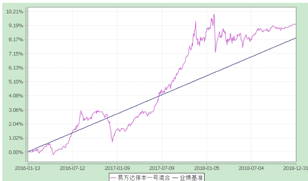
易方达保本一号混合型证券投资基金 份额累计净值增长率与业绩比较基准收益率历史走势对比图 (2016 年 1 月 13 日至 2018 年 12 月 31 日)

注：自基金合同生效至报告期末，基金份额净值增长率为 9.26%，同期业绩比较基准收益率为 8.28%。