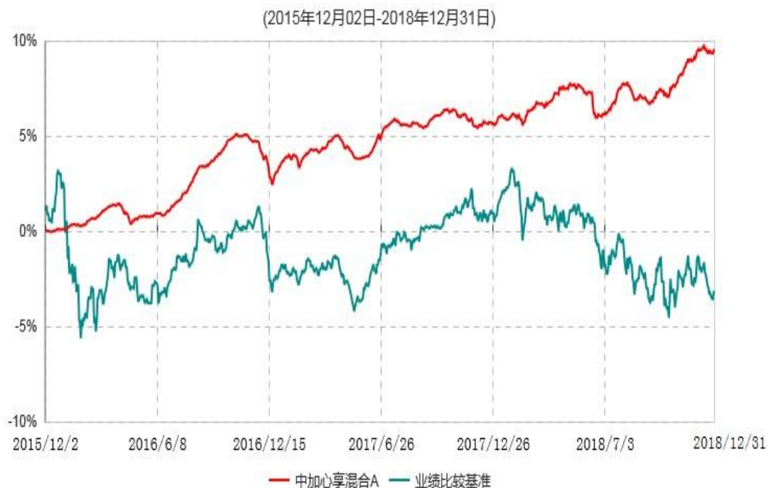
中加心享混合A累计净值增长率与业绩比较基准收益率历史走势对比图