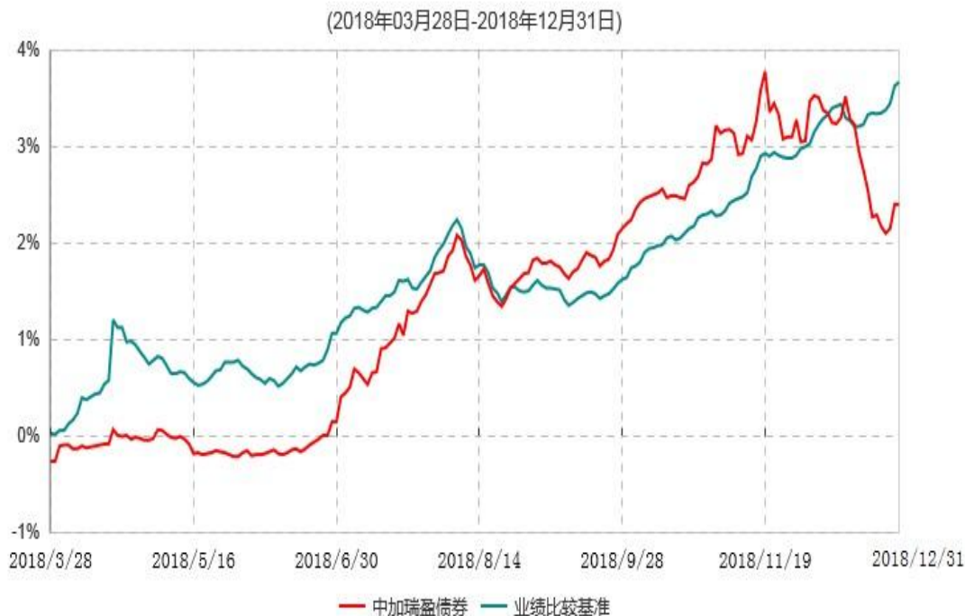
中加瑞盈债券型证券投资基金累计净值增长率与业绩比较基准收益率历史走势对比图

注：1. 本基金转型日为2018年3月28日，截至本报告期末，转型未满一年。 2. 根据转型相关公告和基金合同约定，本基金投资转型期为自转型之日起不超过3个月。投资转型期结束日（2018年6月27日）起次个工作日本基金的各项投资比例符合基金合同有关约定。