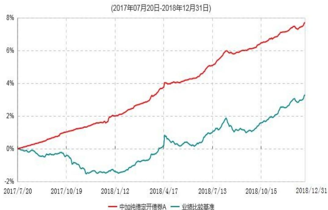
中加纯债定期开债券A累计净值增长率与业绩比较基准收益率历史走势对比图